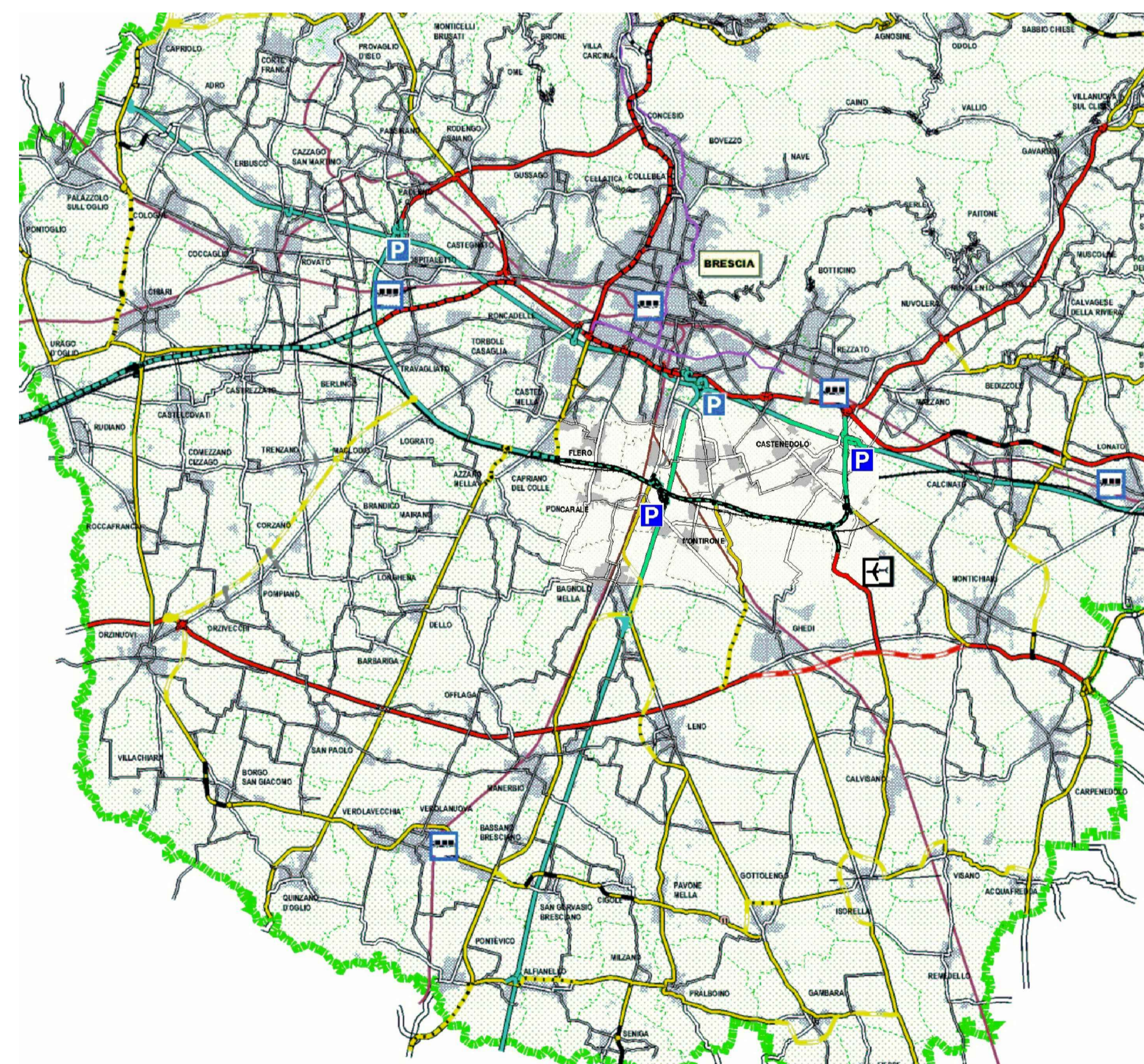
ESTRATTO PIANO DELLA VIABILITA' PTCP BRESCIA 1:200 000